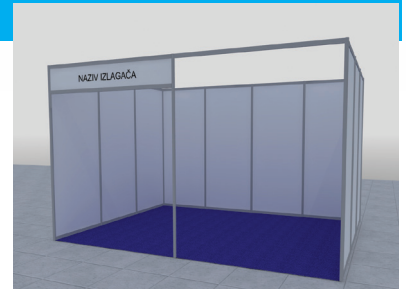
Slika je ilustrativnog karaktera za štand 12m 2