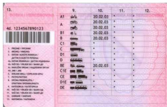
Slika 2. Zadnja strana vozačke dozvole