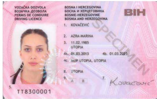
Slika 1. Prednja strana vozačke dozvole